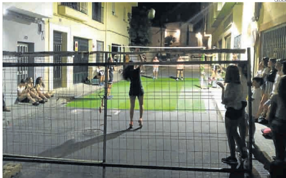
►► Se adaptaron espacios e iluminación para la competición nocturna.

que otros años contando con su correspondiente entrega de premios para los vencedores.