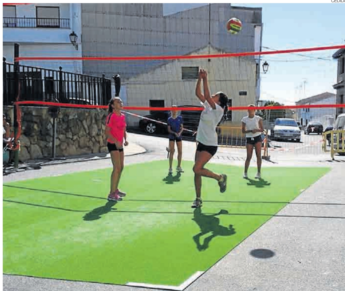
►► El formato del torneo de voley calle enfrentaba parejas exclusivamente masculinas o femeninas.