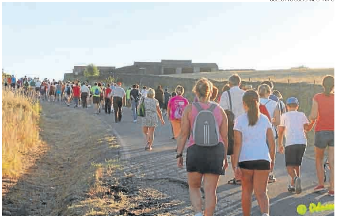
► Los participantes de la marcha pedestre subiendo la Cuesta de Los Gallos, una parte del recorrido.

El colectivo de mujeres de Luz Chinata supo introducir e implicar al público en el ambiente temático de las jornadas con un animado cuadro al ritmo del tema musical «Las panaderas». El acto incluyó dos proyecciones de vídeo. El primero trató el proceso tradicional de la elaboración del pan y el segundo la in-