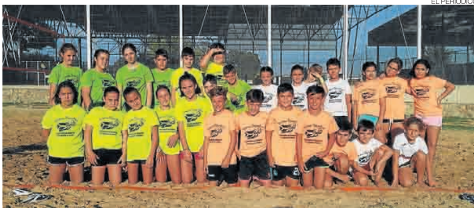
►► Niños tras el campeonato de voley playa en las pistas de arena.