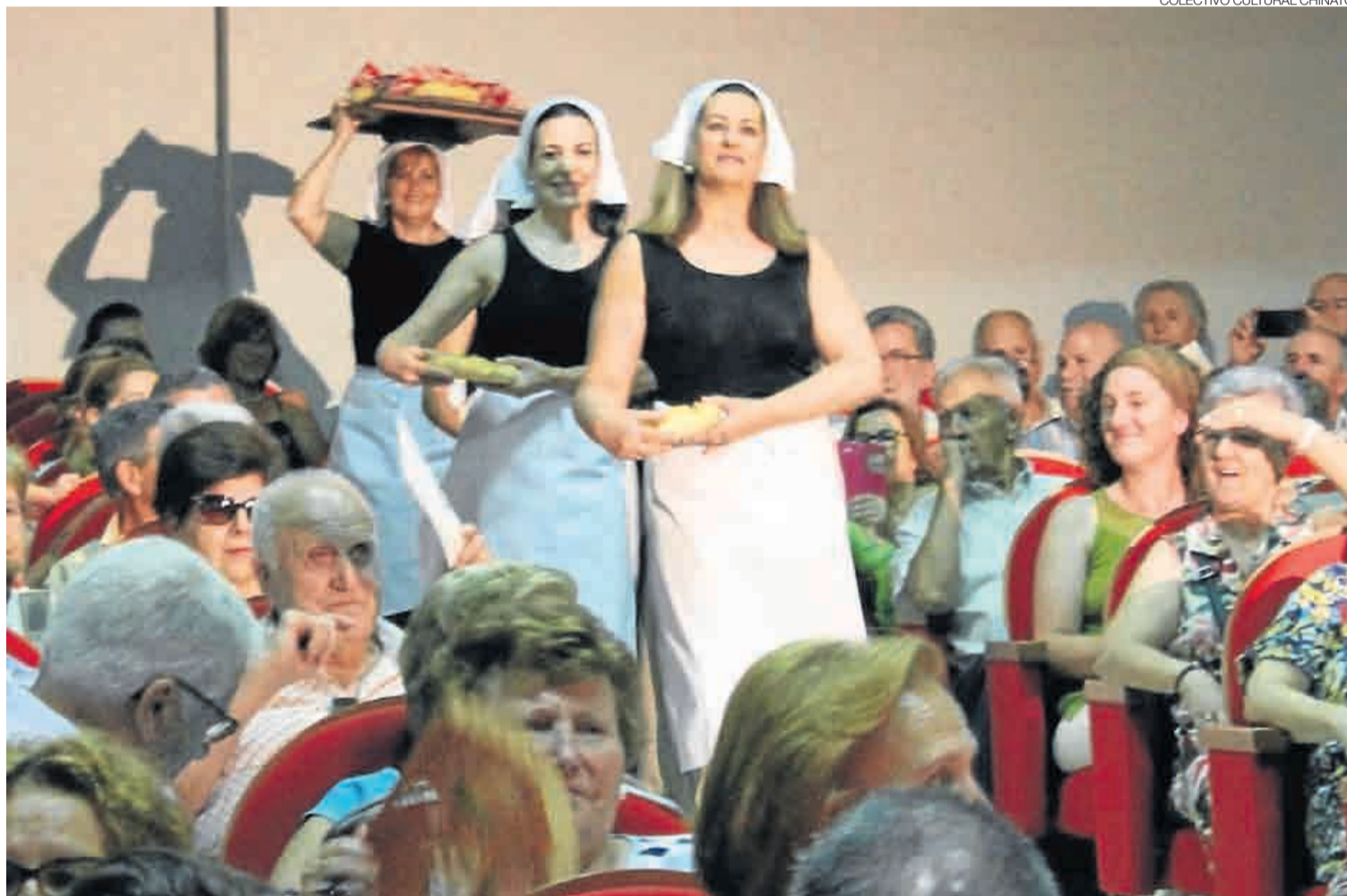
►► Una mujeres vestidas de panaderas desfilan en el salón de actos donde se celebraron las XIV Jornadas del Emigrante.