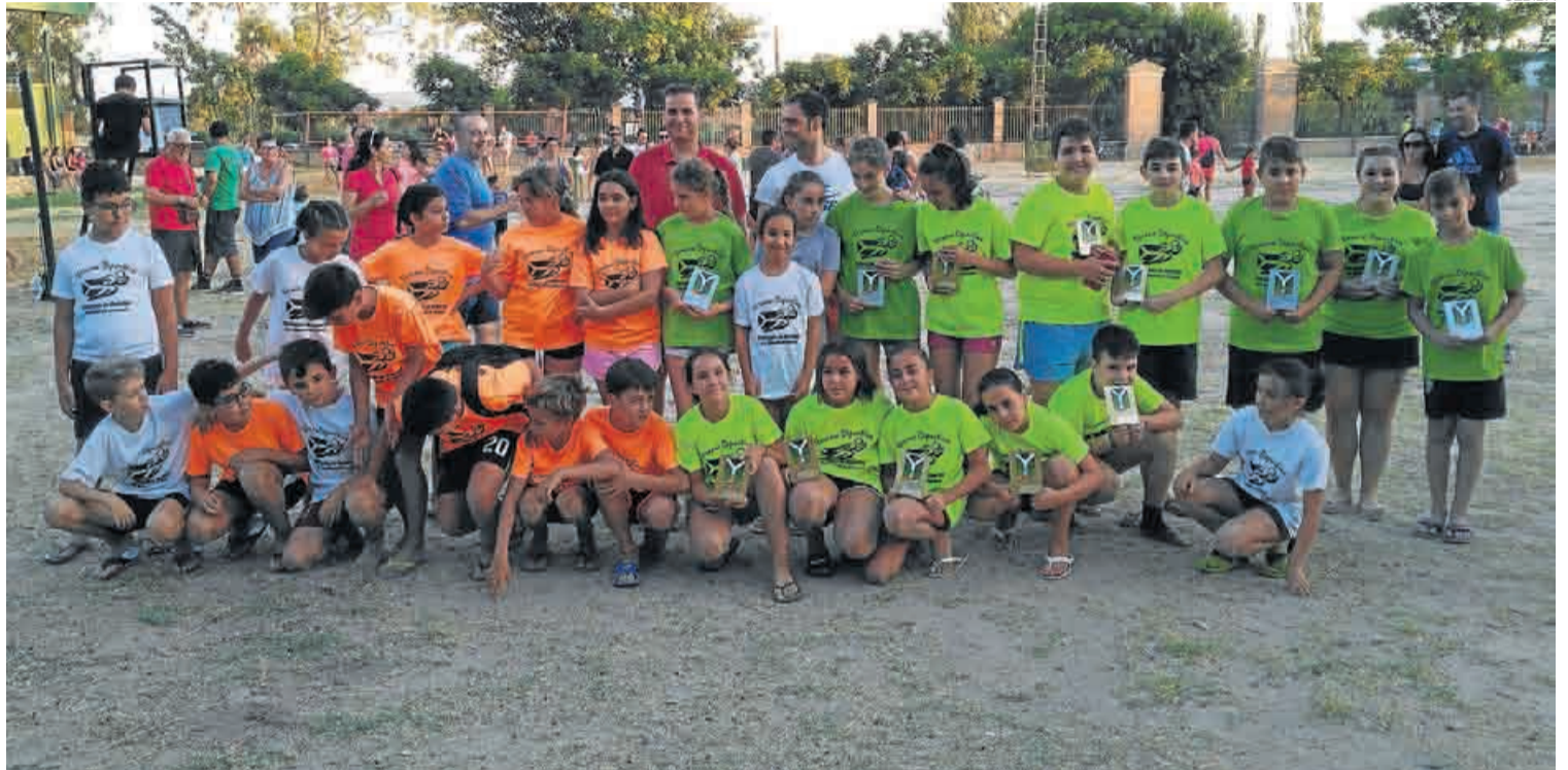
► Niños participantes en el torneo de voley playa Infantil en las pistas de arena tras el torneo.

VOLEY PLAYA // Es con seguridad el deporte preferido durante los meses de verano, por lo que se han desarrollado partidos y campeonatos durante los meses de julio y agosto. Esta actividad tan deseada por niños, jóvenes y no tan jóvenes se convierte durante estos meses en imprescindible dentro del programa ofertado en la