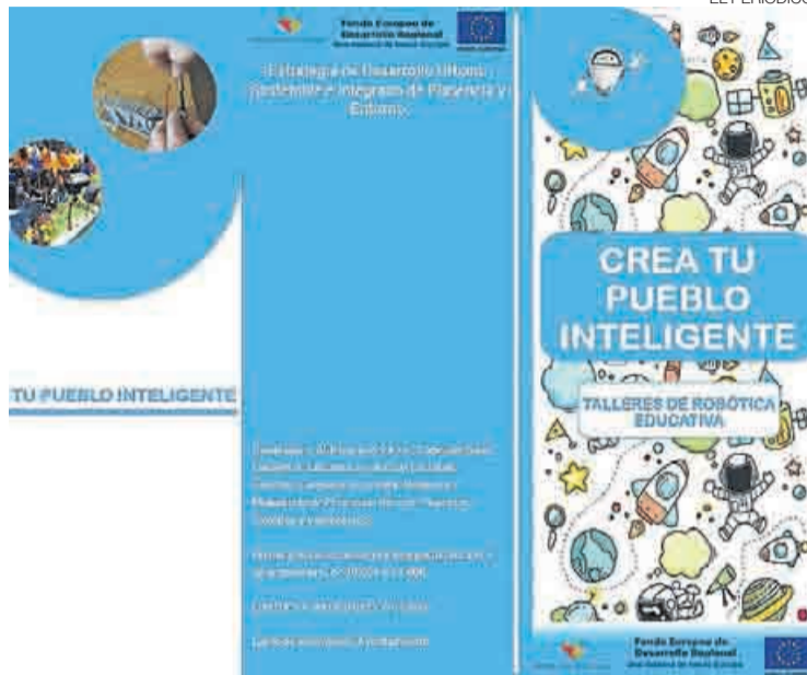
► Cartel relativo a la programación desarrollada en el taller.

► Robótica, internet, programación, drones y tecnología fueron parte del programa