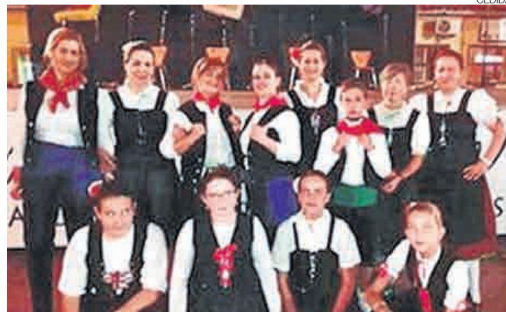
►► El programa cierra con la actuación del grupo Luz Chinata.

Septiembre dará comienzo con la II edición del Festival de Carnaval Canino Chinato, el sábado en la caseta municipal a las 18.00. A las 22.00 horas tendrá lugar la Gala Verano 2018. Exhibiciones de baile moderno,