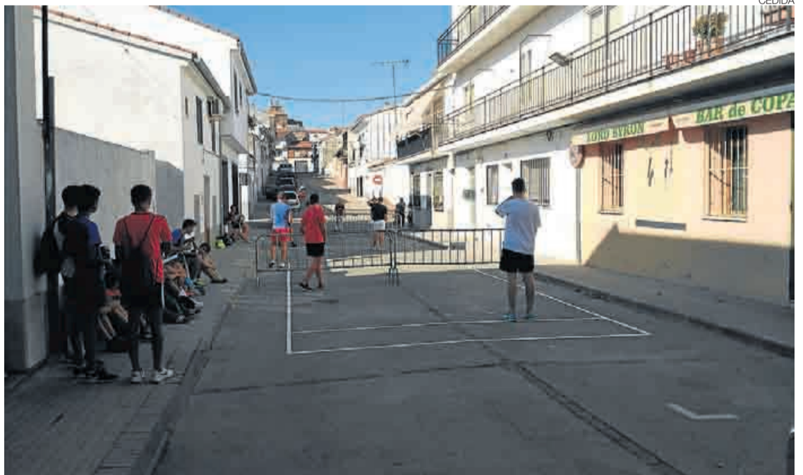
► Jóvenes disfrutan del torneo de fútbol tenis en un campo improvisado con vallas como red.

TORNEO VOLEY PLAYA INFANTIL // A colación del anterior, se celebra una versión infantil en las pistas de arena, también durante los