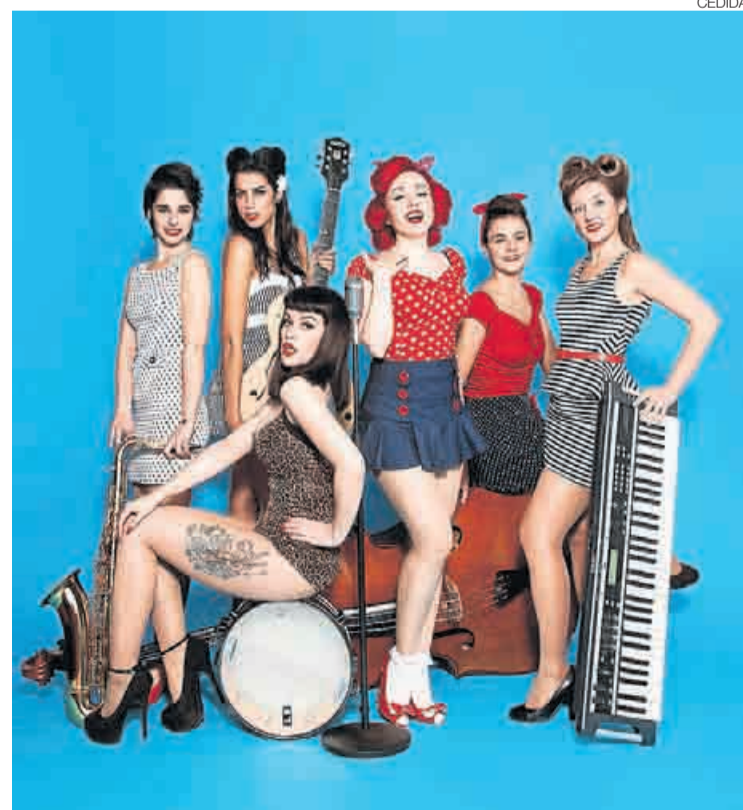
► The Ladies, que actuó en Malpartida el pasado viernes 17 de agosto.