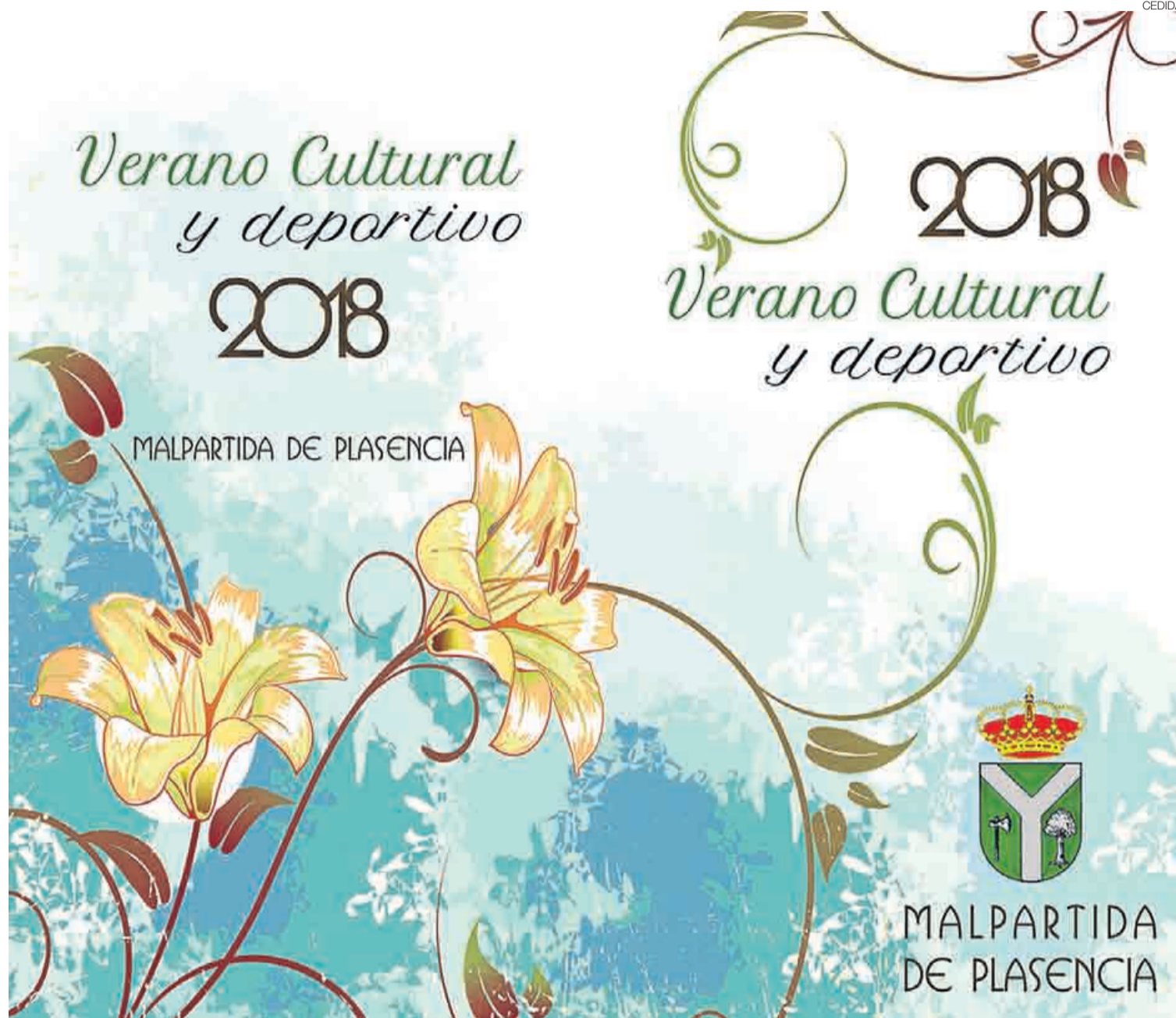
►► Cartel del programa de actividades del Verano Cultural y Deportivo 2018.

El viernes 10 de agosto se celebró el Festival Folclórico de Los Pueblos del Mundo con distintas actuaciones de grupos internacionales. Ese fin de semana tuvo lugar el popular Carnaval