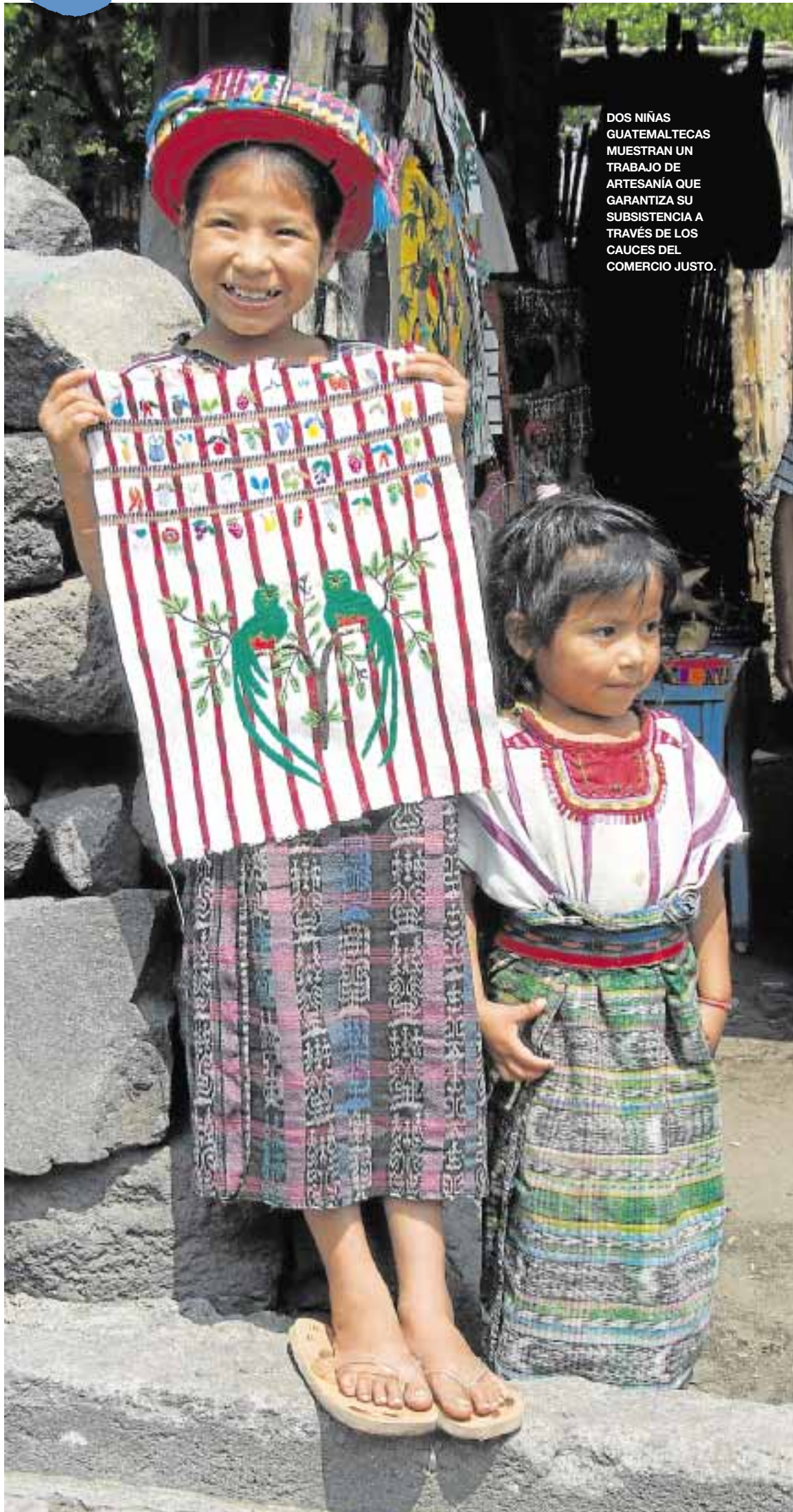
DOS NIÑAS GUATEMALTECAS MUESTRAN UN TRABAJO DE ARTESANÍA QUE GARANTIZA SU SUBSISTENCIA A TRAVÉS DE LOS CAUCES DEL COMERCIO JUSTO.