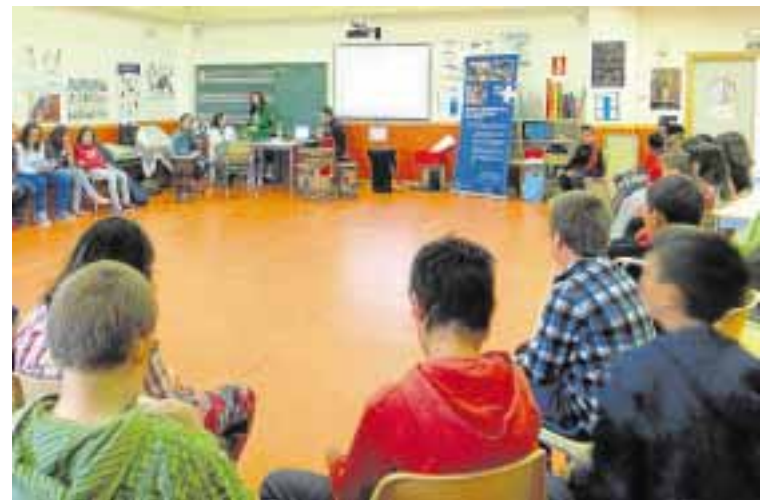
EN LA FILA DE ARRIBA: CHARLA PARA MUJERES SOBRE COOPERACIÓN AL DESARROLLO EN DAROCA Y UN FESTIVAL DE FIN DE CURSO PARA ESCOLARES EN ILLUECA Y BREA CON LA COLABORACIÓN DE MÉDICOS DEL MUNDO. ABAJO, JUEGOS INFANTILES SOLIDARIOS Y UNA DE LAS ACTIVIDADES DE FIN DE CURSO EN UN COLE DE DAROCA.