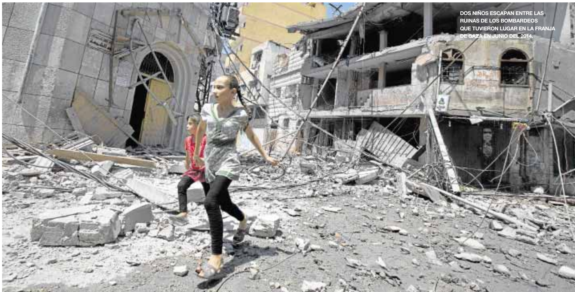
DOS NIÑOS ESCAPAN ENTRE LAS RUINAS DE LOS BOMBARDEOS QUE TUVIERON LUGAR EN LA FRANJA DE GAZA EN JUNIO DEL 2014.

CRUZ ROJA UNA ACCIÓN DE COOPERACIÓN DIRECTA Y URGENTE