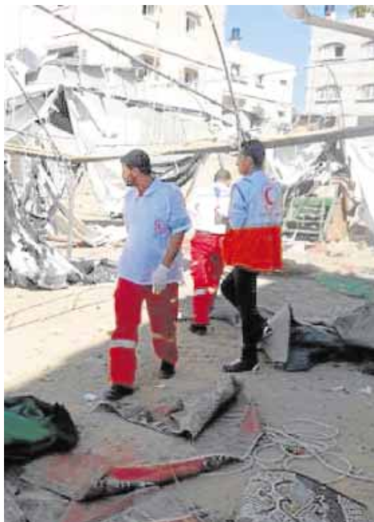
SANITARIOS DE LA MEDIA LUNA ROJA EN PALESTINA.

cobertura de las necesidades inmediatas de la población civil afectada por las hostilidades que comenzaron a mediados del mes de junio.